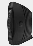
モトローラ製 CATV用モデム (黒色又は白色)

A 当社で貸し出ししています Motolola製モデムのランプの状況をご確認ください。 ※050IP電話をご利用のお客様は直接お問い合わせ下さい